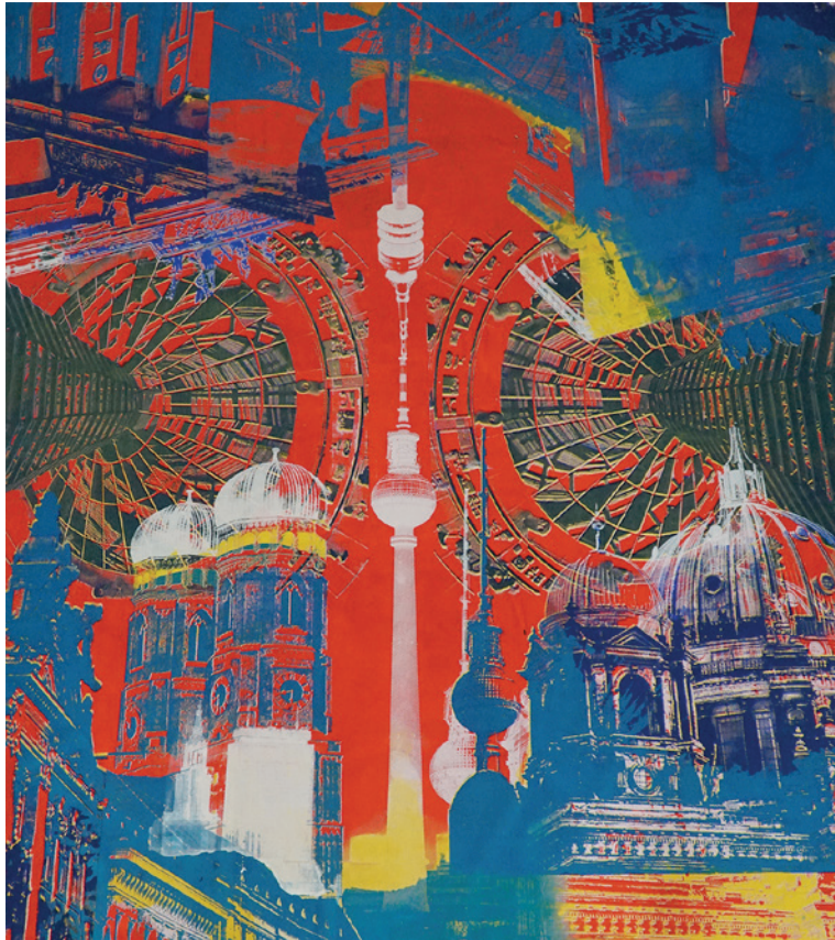
DIE WEISEN MUSEN I Serigrafie auf Leinwand 3 m x 3 m | 2018 Unikat | 15.000.- Euro