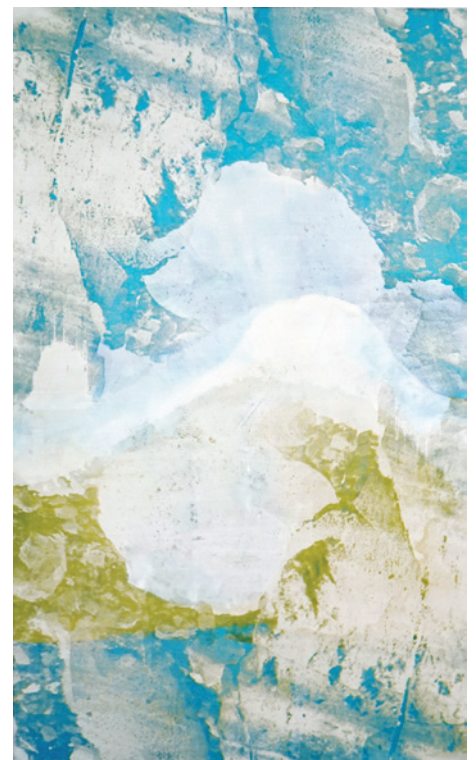
DIE WEISEN MUSEN II - III Serigrafie auf Leinwand 120 x 200 cm | 2018 Unikat | 6.000.- Euro

HARFENKONZERT Langen Nacht der Kirchen Freitag, 27 Juli | 21:30 Uhr